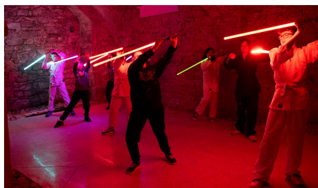
Photos : Le Sabre Laser un sport et un loisir.

https://www.facebook.com/SabreLaserMutzigMolsheim/