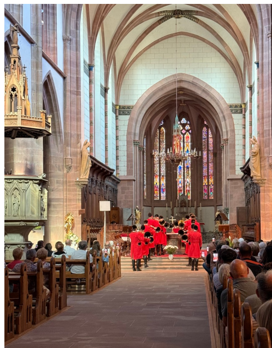
Concert des Cors de chasse de Mollkirch