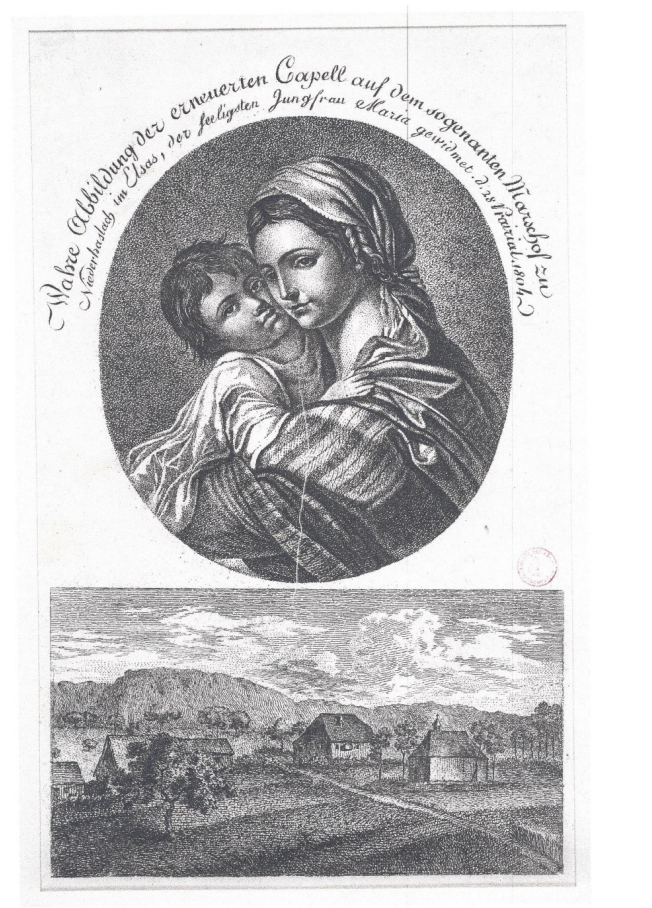
Statue de la Vierge Marie d'après une estampe de 1804 En dessous la chapelle du Marxhof avec son clocheton

Le terrain jouxtant la chapelle était une propriété privée que le propriétaire céda gracieusement à la commune en 1996, tout comme le chemin d'accès dont la municipalité fit l'acquisition en 2013.