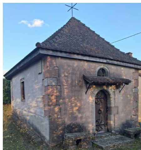
La chapelle aujourd'hui