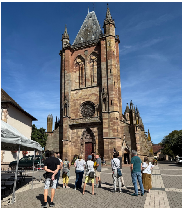
Soleil au rendez-vous pour les visites extérieures

Les visites commentées de l'église ont été particulièrement appréciées, offrant aux visiteurs l'occasion d'explorer l'édifice sous un jour nouveau, guidés par la passion de nos historiens locaux. En complément, un parcours de jeu a permis aux petits et grands d'explorer de manière ludique les détails architecturaux de la Collégiale.