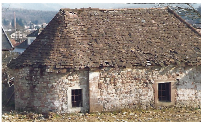
Chapelle avant la restauration de 1991