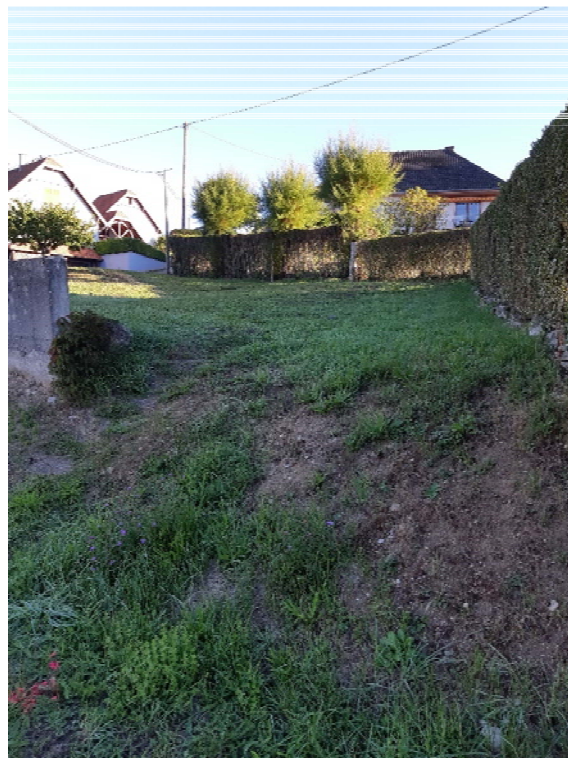
Partie Sud du sentier vue depuis la rue Principale (parcelle 118/o.5)