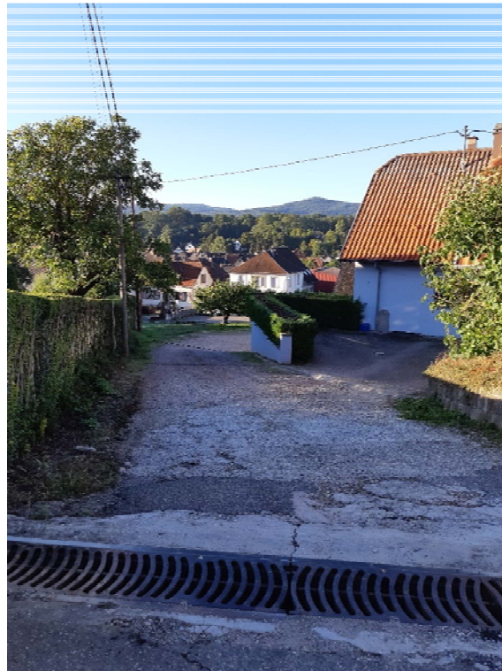
Partie Nord du sentier vue depuis la rue du Calvaire (parcelle 117/o.5)