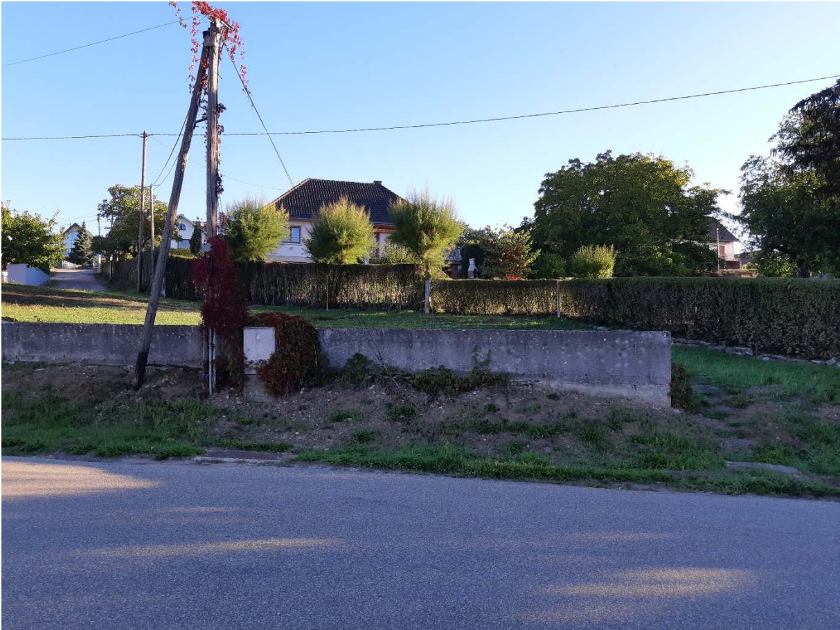
Vue globale du sentier prise depuis la Rue Principale